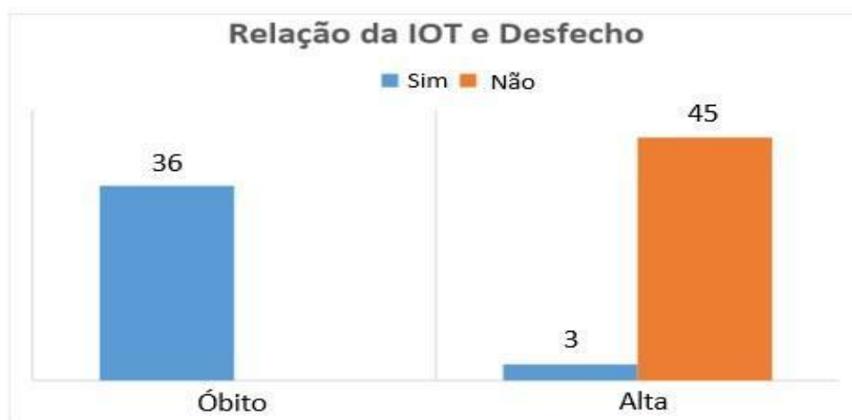
Figura 2- Desfecho da IOQ

Legenda: Relação dos pacientes submetidos à IOT e o desfecho final (alta/óbito).