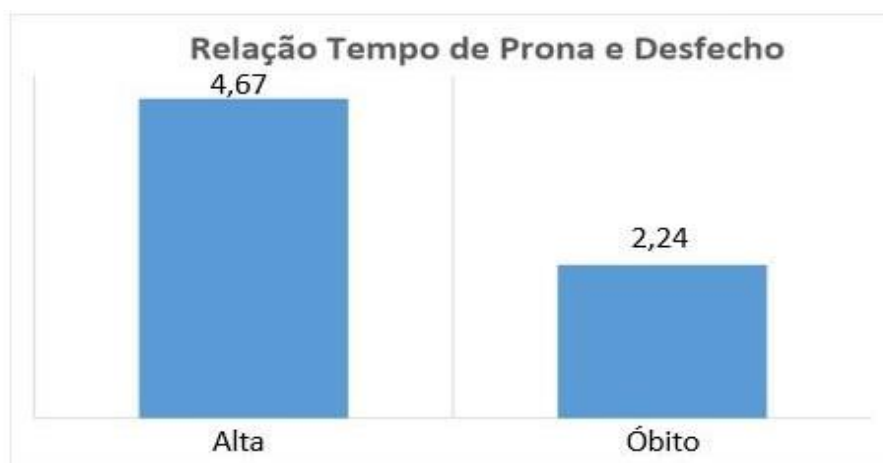
Figura 3 - Relação tempo de prona e desfecho (alta/óbito).

Legenda: Comparativo entre alta e óbito de acordo com o tempo em prona.