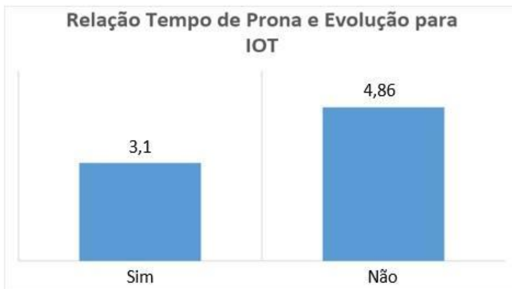
Figura 1 - Evolução para IOT

Legenda: Relação tempo de prona e evolução para IOT em pacientes que foram submetidos à posição de prona sem intervenção respiratória invasiva.