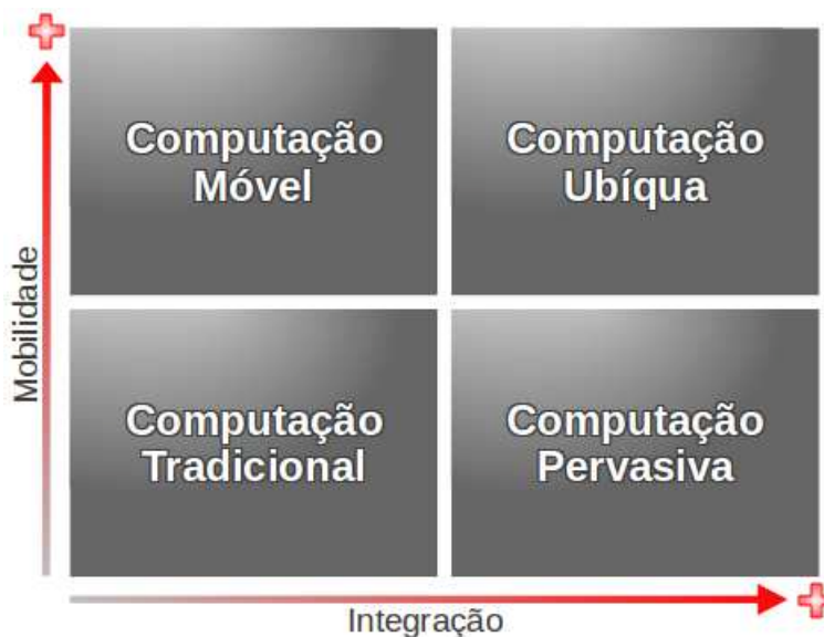
Figura 2. Computação tradicional, móvel, pervasiva e ubíqua representadas em termos de mobilidade e integração (LYYTINEN & YOO, 2002).

Por outro lado, para Barton & Pierce (2007), a computação pervasiva possui a ubiquidade como uma característica fundamental, a qual permite que atividade computacional seja contínua no tempo e no espaço. Na opinião destes autores, outros atributos da computação pervasiva são invisibilidade, pois a computação deve ajudar, sem se tornar a atividade central; conexão física-virtual, onde a experiência do usuário pode depender e se beneficiar da localização, orientação e presença de outras pessoas ou objetos; e heterogeneidade, pois tipos diferentes de dispositivos e redes deverão ser intergrados.