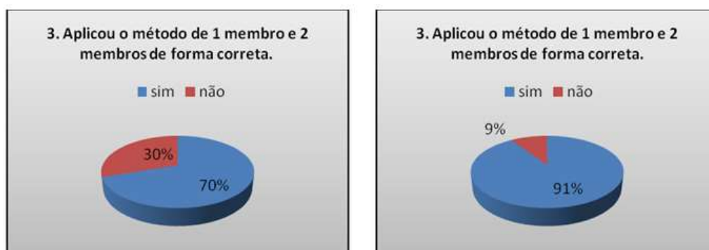
GRAFICO 3 – Comparativo das respostas da terceira pergunta no momento A e no momento B em que identifica se os alunos conseguiram aplicar o método de 1 membro e 2 membros de maneira correta.

que as escolas não devem se preocupar com o uso das tecnologias em si, mas em como usá-las de maneira eficiente.