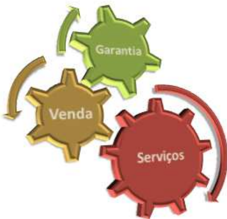
Figura 03: Ciclo da Prestação de Serviços – Ilustrativo.

Ao programar os serviços prestados foi preciso considerar o objetivo principal do projeto: Promover maior sustentabilidade ao negócio no mercado europeu, atendendo sua demanda e suprimindo sua necessidade pela prestação de serviços – com a necessidade mais básica e óbvia de qualquer empreendimento: LUCRO . Assim, desenvolveu-se uma linha de serviços capaz de atender tanto o cliente que já adquiriu produtos Link! Matrizol, e, dentro do período de garantia de seu produto, precisam de atendimento, quanto àquele cliente cujo tempo de garantia está acabado. Considerando que o tempo de garantia da maioria dos produtos comercializados é de dois anos, e que as atividades de ambas as empresas antes da incorporação iniciaram-se em 2008, o perfil de cliente que representa consumo ativo e capacidade de gerar lucro, compreende mais de 50 % da carteira de cliente européia.