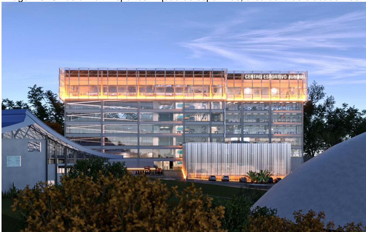
Imagem 3: Ginásio Multi Esportes – quadras esportivas, área de lutas e academias