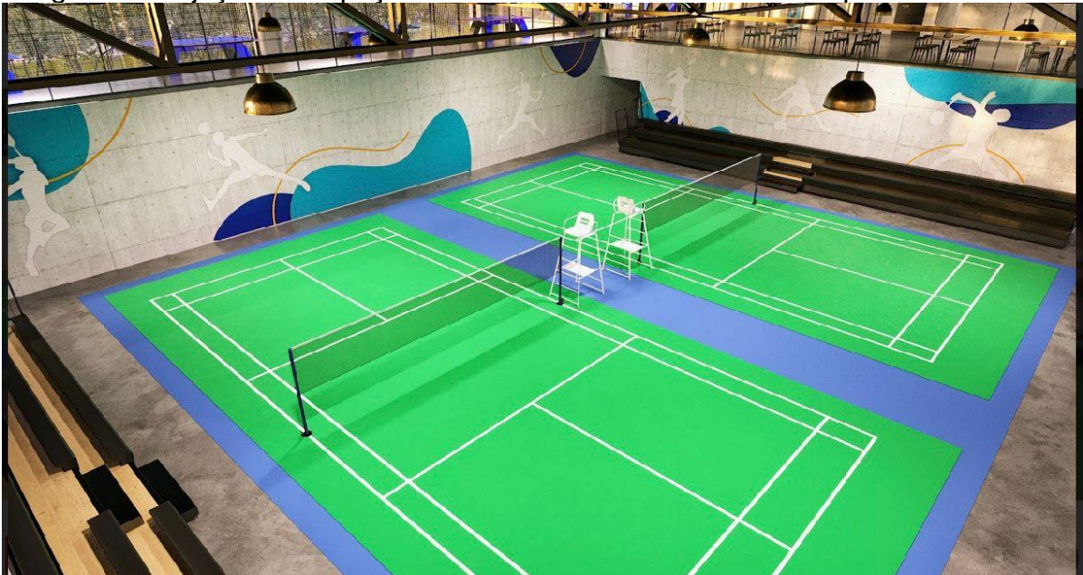
Imagem 7: Projeção do espaço do badminton no Ginásio Multi Esportes