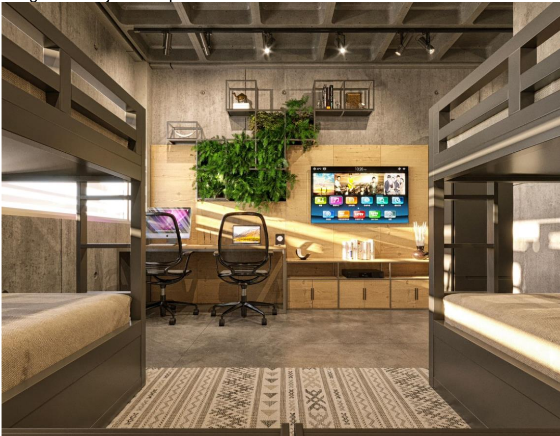
Imagem 8: Alojamento para atletas na Nova Sede administrativa da UGEL