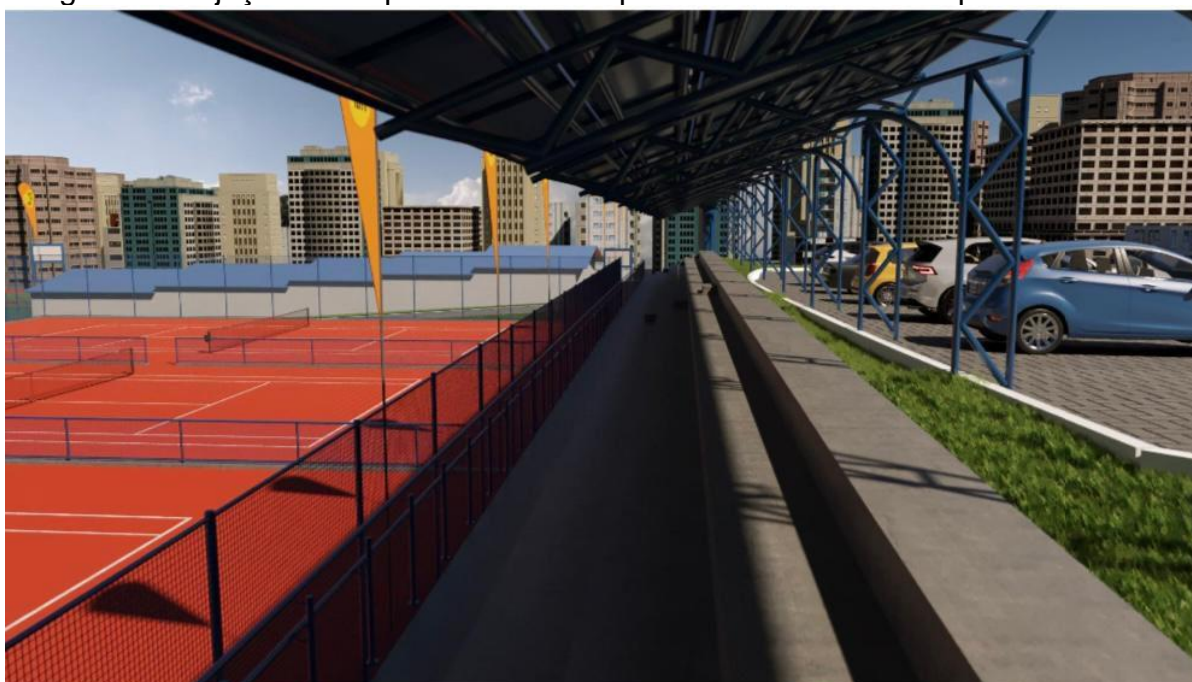
Imagem 1: Projeção da arquibancada nas quadras de tênis do complexo