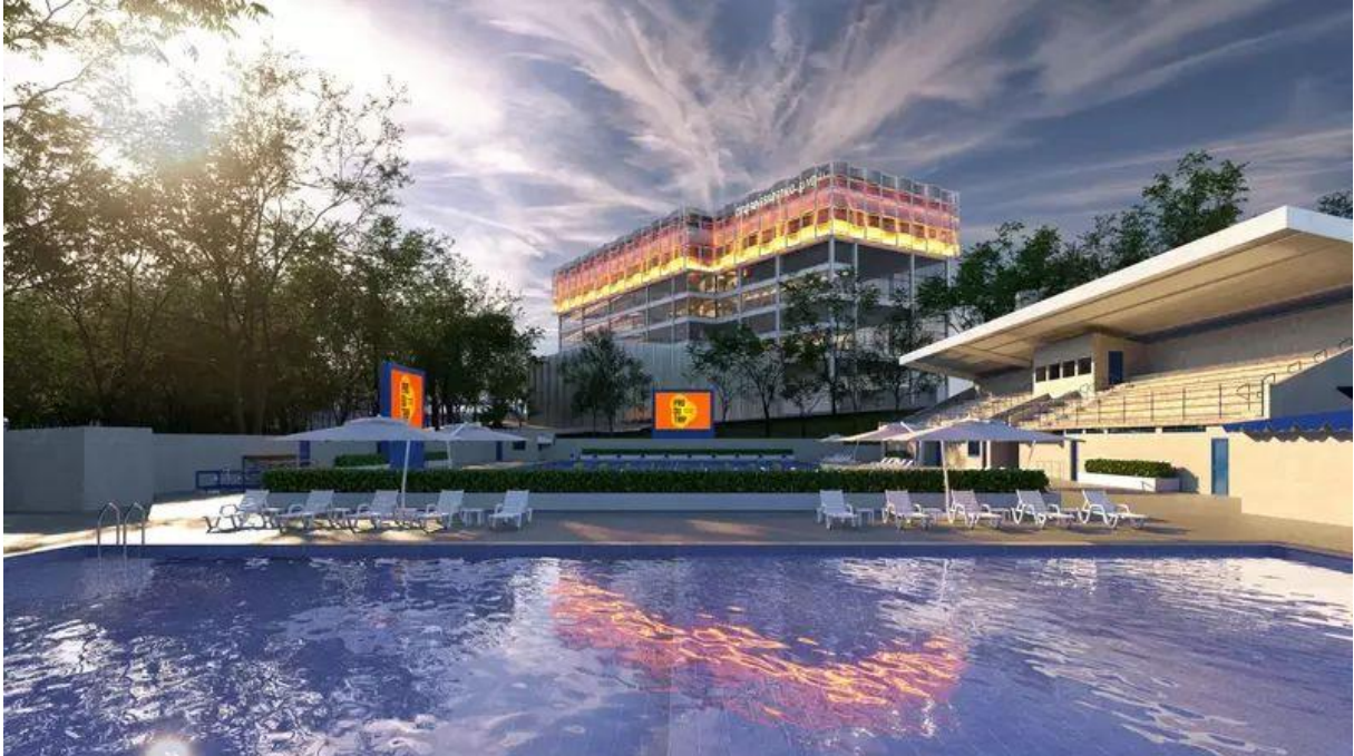
Imagem 5: Projeção do Ginásio Multi Esportes integrado ao complexo