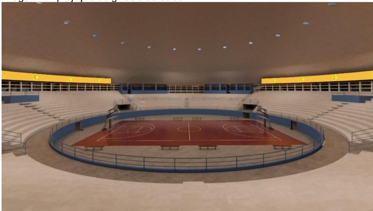
Imagem 2 – projeção do ginásio do bolão