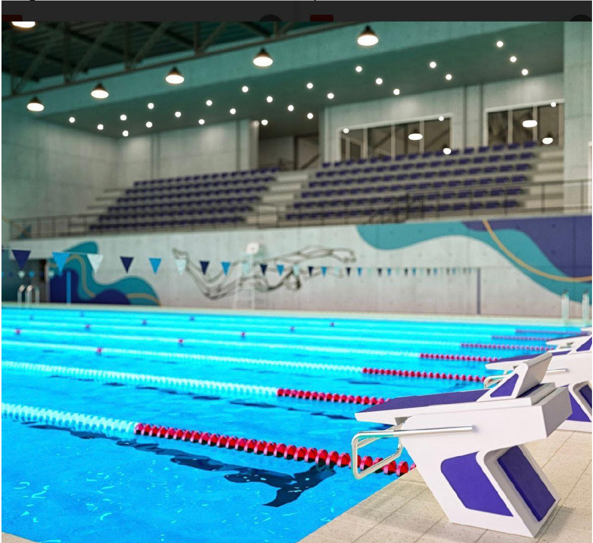
Imagem 4: Nova Piscina no Ginásio Multi Esportes